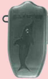
Estuche de protección